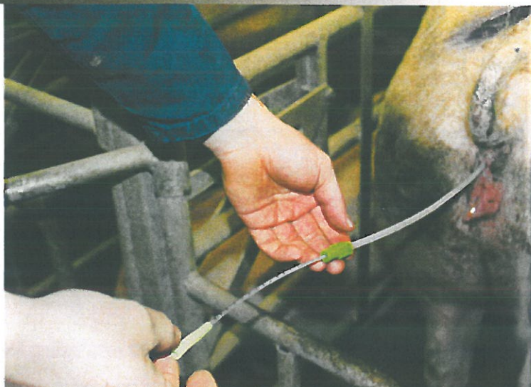
Wauters past ook intra-uterine inseminatie toe.

Berts bedrijfsresultaten over het gehele jaar 2017 beschouwend blijkt dat er – over alle aanwezige zeugen heen (de gelten inbegrepen dus) – een vooruitgang geboekt werd van 1,2 big per zeug. "Slechts de helft daarvan zetten we eerlijkheidshalve op rekening van de Pigwatch. De andere helft is allicht een combinatie van genetisch vooruitgang en beter