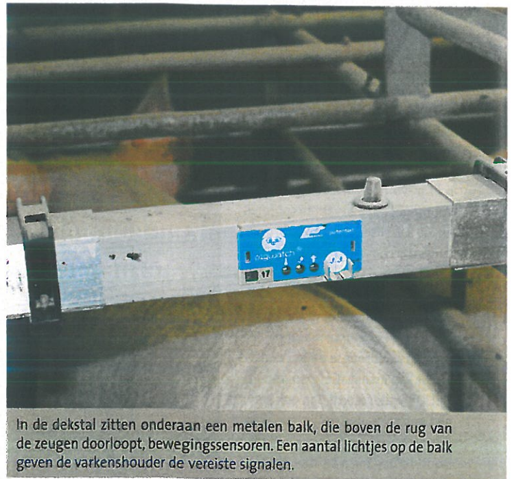
In de dekstal zitten onderaan een metalen balk, die boven de rug van de zeugen doorloopt, bewegingssensoren. Een aantal lichtjes op de balk geven de varkenshouder de vereiste signalen.

Aanvankelijk werd er gewerkt met twee grafieken die op een van kleur wisselende achtergrond (geel werd langzaam rood) geprojecteerd werden. "Die toeters en bellen zijn er allemaal afgehaald", getuigt de dierenarts verder. "Algoritmes maken op basis van de bewegingssensoren uit of de zeug bronstig of niet-bronstig is. Zodra ze bronstig is wordt er nog slechts één curve geproduceerd die het verloop van de verdere bronst aangeeft. Er komt verder ook slechts één streep die aangeeft wanneer men best insemineert. Is dat gebeurd en bevestigd, dan verschijnt er een blauw druppeltje op de grafiek."